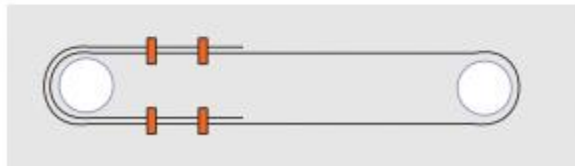
Cách thắt dây tốt nhất và được khuyến nghị