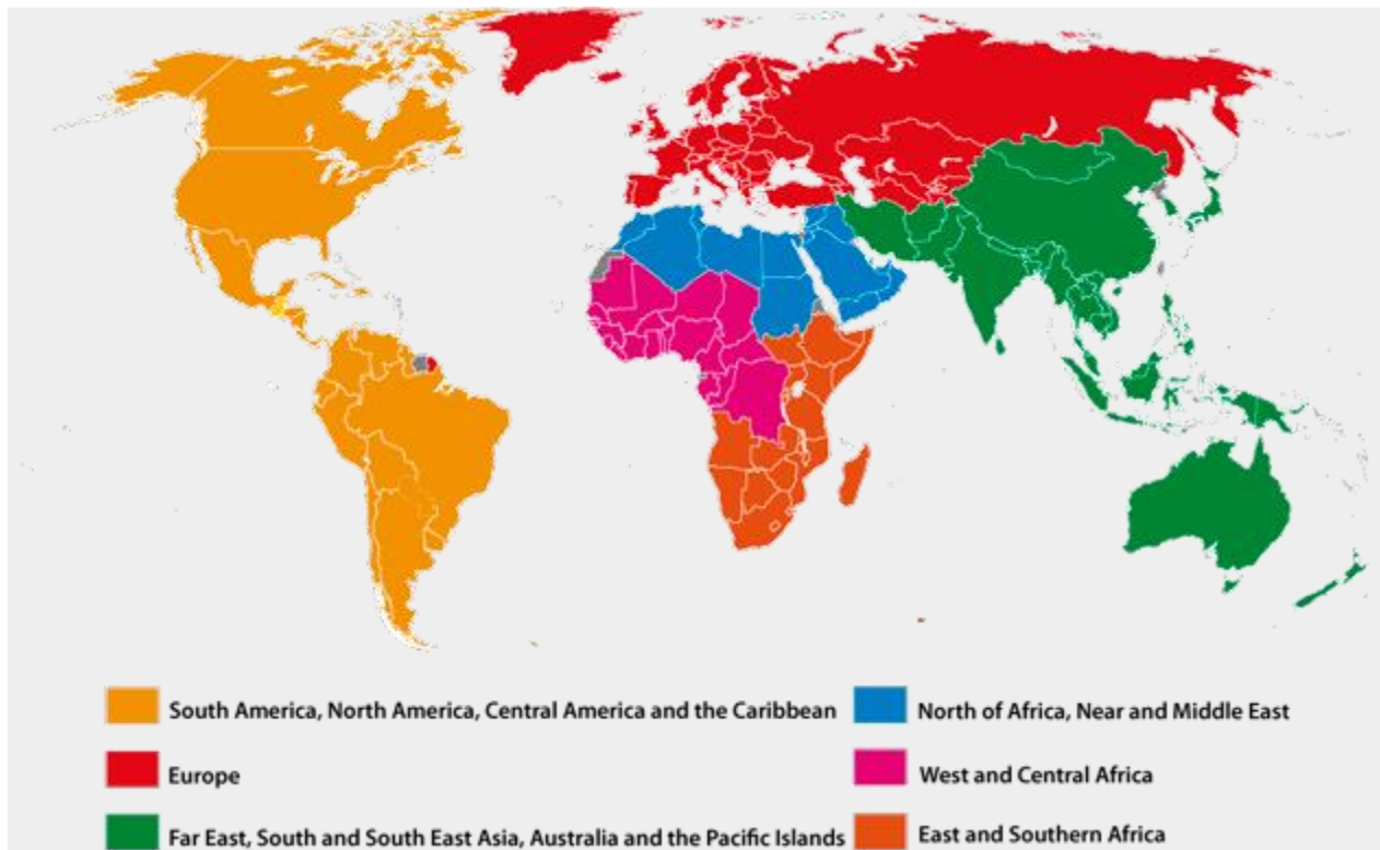
Bản đồ các quốc gia thành viên WCO

Tổ chức Hải quan thế giới (WCO – World Customs Organization) thành lập năm 1952, có trụ sở đặt tại Brussels (Bỉ), là một tổ chức liên chính phủ độc lập với mục tiêu thúc đẩy hoạt động quản lý hải quan một cách hiệu quả. Đến nay, WCO có 179 quốc gia thành viên.